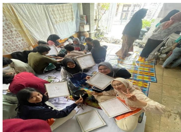
Gambar 3. Proses pencantingan batik oleh mahasiswa Program Studi Kewirausahaan UNIMED

Kegiatan ini juga memberikan dampak positif bagi UMKM Batik Batak Melayu, karena mendapatkan ide-ide desain yang lebih inovatif dan strategi promosi berbasis digital dari mahasiswa. Dengan adanya kolaborasi ini, tercipta hubungan timbal balik yang saling menguntungkan antara dunia akademik dan dunia usaha lokal. Menurut Qorib (2024), kolaborasi antara perguruan tinggi, dunia industri, dan masyarakat menjadi kunci utama dalam mendorong inovasi daerah. Dari perspektif sosial, kegiatan ini menciptakan perubahan positif berupa meningkatnya kesadaran mahasiswa terhadap pentingnya pelestarian budaya lokal dan semangat kewirausahaan sosial. Hal ini menunjukkan terjadinya proses transformasi sosial, di mana mahasiswa tidak hanya berperan sebagai pelajar, tetapi juga sebagai agen pelestarian budaya dan penggerak ekonomi kreatif. Sebagaimana dijelaskan oleh Riswanto et al., (2023), kreativitas merupakan modal penting dalam ekonomi modern yang berbasis ide dan inovasi, sedangkan menurut BARKAH (2025), pengembangan wirausaha berbasis budaya dapat memperkuat identitas bangsa sekaligus meningkatkan daya saing ekonomi lokal. Secara keseluruhan, kegiatan pengabdian ini telah mencapai tujuan utamanya, yaitu mengembangkan kreativitas mahasiswa, memperkuat kolaborasi antara kampus dan UMKM, serta menumbuhkan semangat kewirausahaan berbasis budaya lokal.