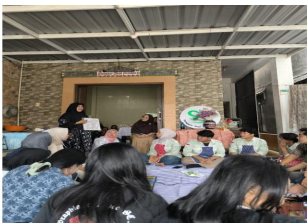
Gambar 2. Penyampaian materi oleh instruktur dari UMKM Batik Batak Melayu

Kegiatan Pengabdian Masyarakat ini melibatkan tim dosen, mahasiswa, serta pemilik UMKM Batik Batak Melayu sebagai mitra utama. Pelaksanaan kegiatan berjalan secara partisipatif, di mana mahasiswa terlibat aktif sejak tahap perencanaan hingga evaluasi, sehingga kegiatan ini menjadi pengalaman belajar yang bermakna dan aplikatif. Pelatihan dimulai dengan sesi pengenalan tentang sejarah, filosofi, dan nilai-nilai budaya yang terkandung dalam batik Batak dan Melayu. Para mahasiswa diberikan pemahaman mengenai pentingnya pelestarian budaya lokal sebagai bagian dari pengembangan ekonomi kreatif. Selanjutnya, peserta mengikuti praktik langsung membatik mulai dari membuat pola, mencanting, hingga proses pewarnaan kain batik. Selama proses pelatihan, antusiasme mahasiswa sangat tinggi. Mereka menunjukkan minat besar untuk belajar teknik membatik dan mengembangkan kreativitas dalam menciptakan motif baru. Berdasarkan hasil wawancara dan observasi lapangan, kegiatan ini berhasil meningkatkan kemampuan berpikir kreatif mahasiswa, menumbuhkan rasa percaya diri, dan memperluas wawasan mereka terhadap potensi ekonomi dari produk berbasis budaya lokal.