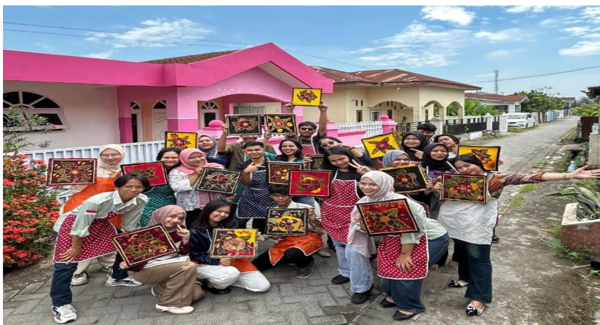
Gambar 4. Mahasiswa Program Studi Kewirausahaan UNIMED berfoto Bersama setelah mengikuti kegiatan pelatihan membatik di UMKM Batik Batak Melayu

Secara teoritis, hasil kegiatan menunjukkan bahwa pembelajaran berbasis praktik lapangan efektif dalam menumbuhkan kemampuan berpikir kreatif dan aplikatif mahasiswa. Adapun rekomendasi dari kegiatan ini adalah perlunya tindak lanjut berupa program pendampingan berkelanjutan yang berfokus pada peningkatan kualitas desain, pengemasan produk, dan strategi pemasaran digital. Selain itu, diharapkan kegiatan serupa dapat diperluas dengan melibatkan lebih banyak mahasiswa dan mitra UMKM lainnya agar dampak positifnya semakin meluas dan berkelanjutan.